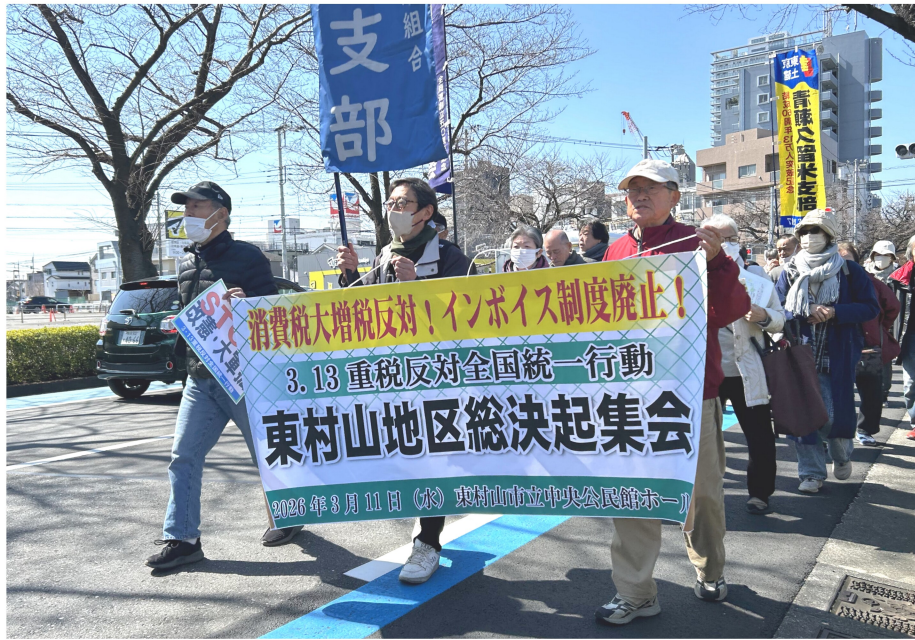
シュプレヒコールを上げながら、東村山の街をデモ行進しました