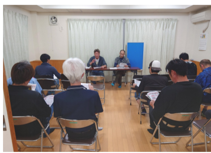
3・4・5群の群会議の様子

した。3つの群で、時間まちまちの80人の出納処理をしていました。読み合わせられなかったのです。仕事や、現場の遠近による参加時間の違いは、最初からわかっていることです。その日に来てくれるだけでありがたいと思うだけです。組合費コンビニ納入方式になって、本当に喜んでいて、群会議担当者で、一般組合員は、二度手間になったと不評でした。この状態で10分間会議を持ち出すのは、厳しいと思っていました。 2025年の住宅デーも終わり一息ついた頃、たまたま四役全員が集まった会議で「やってみるか」の一言。まずは、同じ会場の3・4・5群、