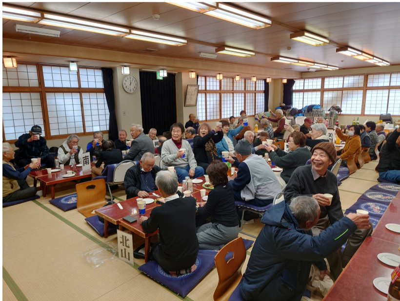
毎年恒例、今年も食べて飲んで盛り上がりました!

2月20日(金) 午後小平福祉会館、和室ホールでけやきの会の新春の集いが開催され、62名を超える仲間が集まり盛大な会になりました。