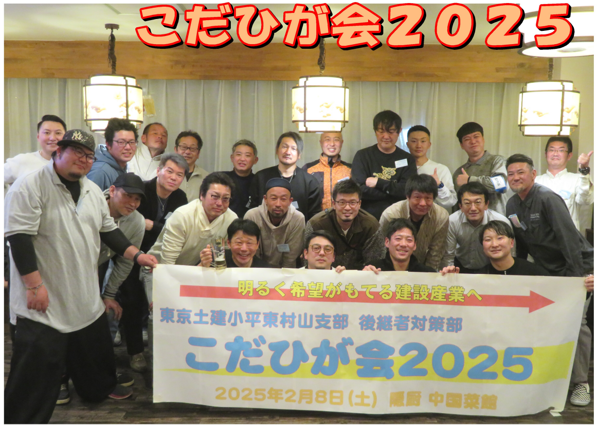
多くの仲間と楽しく交流

2月8日(土)、久米川の中華料理店「隠厨」にて、後継者世代の仲間のつながりを持つイベント「こだひが会」を開催。22名の仲間が集い、交流しました。