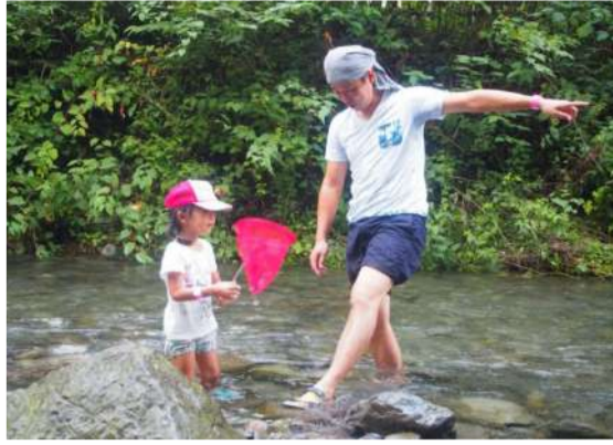
家族でアウトドアを満喫

近頃はアウトドアが流行っているそうです。バーベキューにキャンプ、キャンピングカーなどのニーズをよく見かけます。