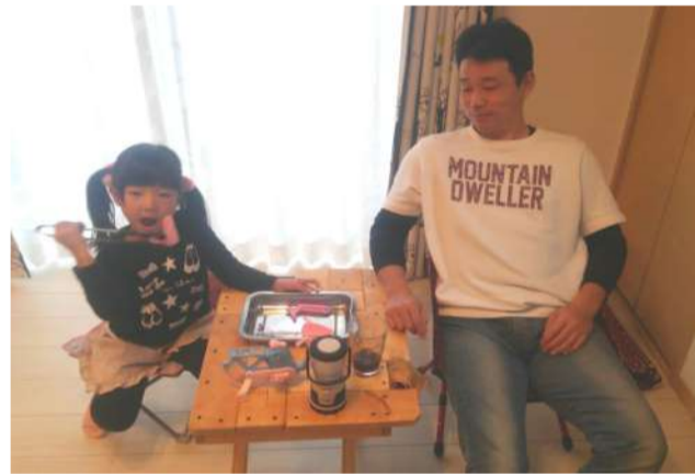
自作のテーブルで“BBQごっこ”

そういう私もアウトドアに興味津々です。薪に火を点ける、炭を熾す、太陽の下で肉を喰らいビールを飲む、大好きです。