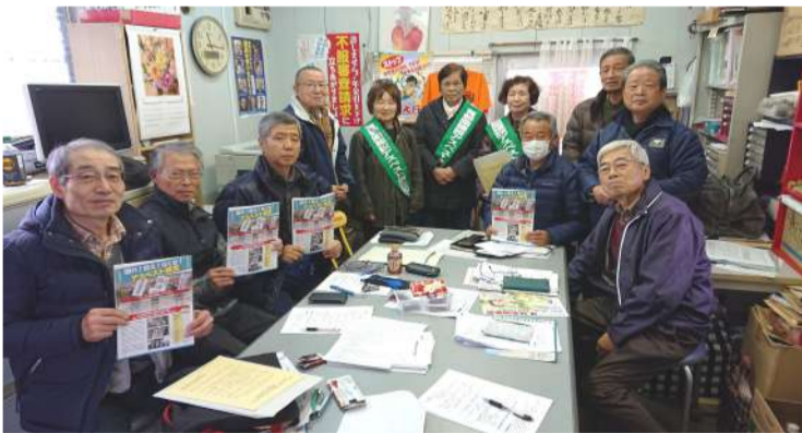
原告団と共に年金者組合東村山支部を訪問した

建設アスベスト訴訟は、提訴から10年、2018年8月と9月に大阪高裁は、国とアスベスト建材メーカーの責任を認める判決を下し、さらにはこれまでに認められなかっただけでなく、中小零細事業主と一人親方への救済を命じる「判決を下しました」問題が終わっていない