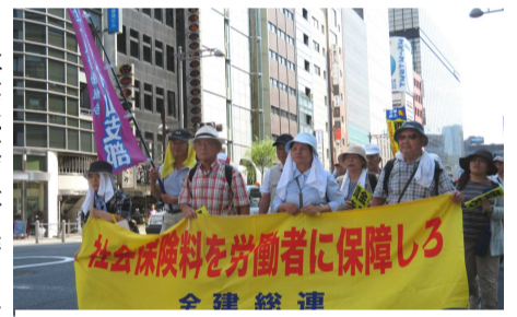
集会後のデモ行進

7月6日(木)建設国保の国庫補助金の現行水準確保、賃金・単価の引き上げ、建設労働者の権利と生活向上を求め、全国から48県連・組合でおよそ4000人(うち支部からは45人)の仲間が日比谷野音音楽堂に集結し、「賃金・単価引き上げ、予算要求中央総決起大会」を開催しました。