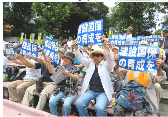
日比谷野音でプラカードを掲げアピール

7月6日(木)建設国保の国庫補助金の現行水準確保、賃金・単価の引き上げ、建設労働者の権利と生活向上を求め、全国から48県連・組合でおよそ4000人(うち支部からは45人)の仲間が日比谷野音音楽堂に集結し、「賃金・単価引き上げ、予算要求中央総決起大会」を開催しました。