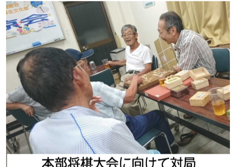
本部将棋大会に向けて対局

士で歓談し、その後は8月本部将棋大会に向けた練習やウノ、オセロなどの各企画に取り組み参加者同士夏休みの過ごし方などの話で談笑しながら各々楽しい時間を過ごしました。途中、厚生文化部長経験者の参加もあり、現部長を激励する一幕もありました。本部の