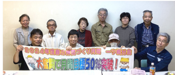
→目標50%達成 (一ツ橋分会)

仲間づくり出陣式を皮切りに、訪問行動を開始。支部目標95名を達成すべく、今回もメリット集を片手に、訪問し、対話を重ねました。出陣式後の訪問行動を経て、