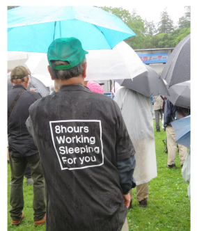
今回のグッズはこちら

5月1日(水)、井の頭公園西園にて第95回三多摩メーデーが開催され、全体で1300名(支部42名)が参加しました。 13時から文化行事が始まると、そのままメーデーが開会。来賓や政党から連帯の言葉、各団体では労働者・国民のたたいが大きく前進している。私たちも賃上げや保険証廃止の反対、消費税減税等の声をあげ、たたいを前進させよう」というメーデー宣言が拍手で採択されました。 最後の「世界では労働者・国民のたたいが大きく前進している。私たちも賃上げや保険証廃止の反対、消費税減税等の声をあげ、たたいを前進させよう」というメーデー宣言が拍手で採択されました。 雨の中は「世界では労働者・国民のたたいが大きく前進している。私たちも賃上げや保険証廃止の反対、消費税減税等の声をあげ、たたいを前進させよう」というメーデー宣言が拍手で採択されました。