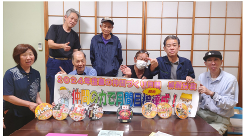
一力を合わせて目標達成 (柳瀬分会)