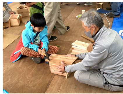
力強く打つ子どもたち

5月12日(日)に「こだいら環境グリーンフェスティバル2024」が小平中央公園で開催され、けやきの会を中心に、木工教室と住宅相談を行いました。 以前までは「こだいらグリーンフェスティバル」と「小平環境フェスティバル」を別日で開催していましたが、今年は併せて「こだいら環境グリーンフェスティバル」として開催。その関係もあり、来場者の出入りが予想以上で、木工キットが大幅に足りなくなるほどの大盛況でした。 私たち東京土建は「巣箱づくり」と住宅相談を10時から開始。幼稚園児から小学生の子供たちに教えながら作ってもらいました。 子供たちからは「とても楽しかった」「巣箱を設置するのが楽しみ」等の感想を頂き、昨年のグリーンフェスティバルで巣箱を作成した市民の方からは「シジュウガラが入って巣作りをしていきます。これから楽しみです！」と声をかけてくれました。嬉しそう