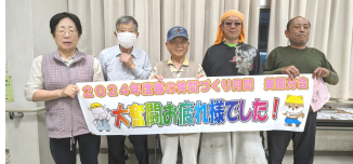
←今春も大奮闘 (美園分会)