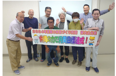
→今年も良いスタートが切れた (野火止分会)