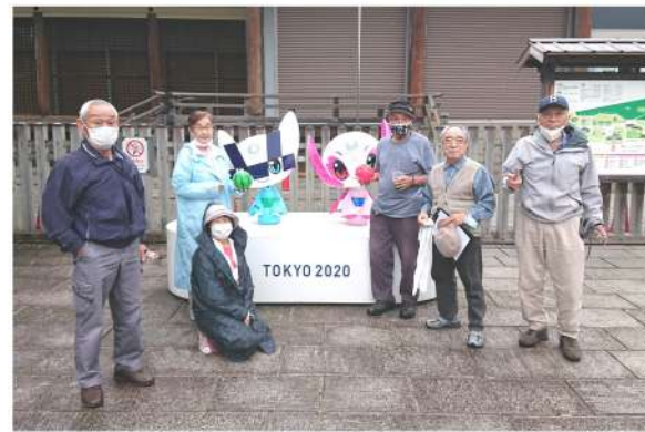
健康について学びながら交流を楽しんだ