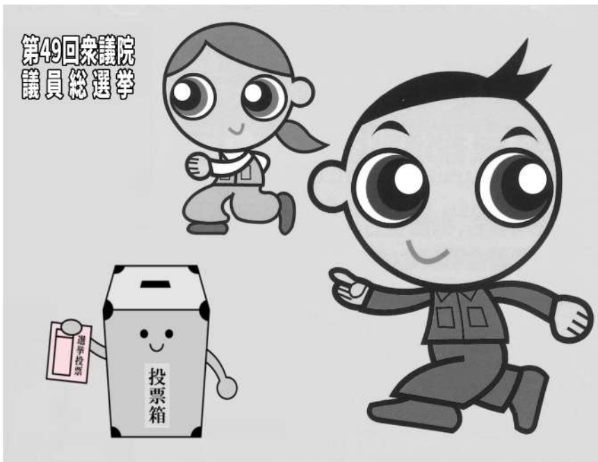
第49回衆議院議員総選挙