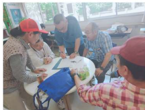
日曜行動も活発に取り組んだ(写真は美園)