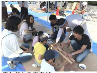
青年部と後継者が協力して取り組んだ