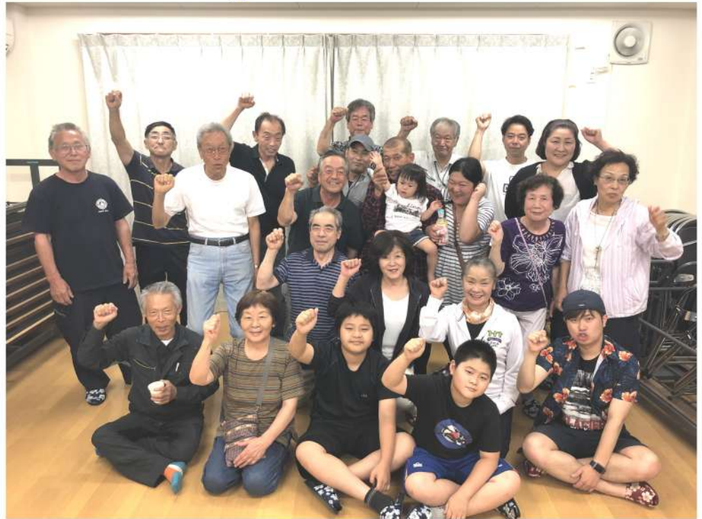
若手事業主の活躍もあり 目標を達成した北山分会

4月から始まった「春の仲間づくり月間」は、5月末時点の最終成果が117名となり、目標の113名を4名超過達成しました。目標達成分会は、花小金井・小平東・野火止・柳瀬・北山・南の6分会となり、昨年を上回る結果となりました。今月間の超過達成へ向けて協力・奮闘されたすべての方へ感謝いたします。