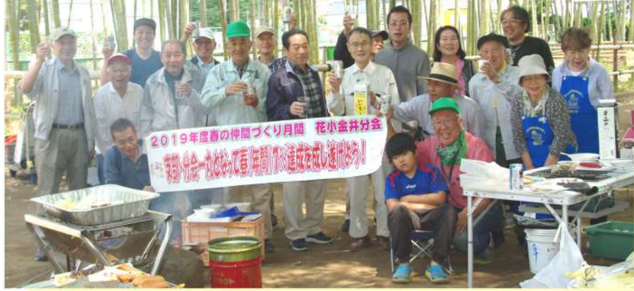
生い茂る竹を背にして