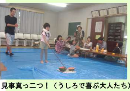
見事真っ二つ！（うしろで喜ぶ大人たち）

地集会所で小川分会のBBQレクを開催しました。好天にも恵まれ、組合員・家族と子ども含め33名の参加で盛大に取り組むことができました。